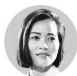
日本のみならず世界中の富裕層が満足するEVを生み出すために、新型車は過酷な状況での走行テストを繰り返した。「初のEVだからこそ、さまざまな気候条件での状態を確認したかった。マイナス40度から50度までの条件でテストを実施した」という。テストでの走行距離は250万キロ以上に及んでおり、「顧客の皆様は品質を約束できる」と胸を張る。

一方で、この時期の気温上昇や長時間走行による熱の影響に注意が必要だ。適切なメンテナンスと予防策を講じることは、安全なドライブを楽しむために欠かせない。エンジンオイルや冷却水、タイヤのチェックなど、こまめなケアが車のパフォーマンスを維持し、トラブルを未然に防いでくれる。