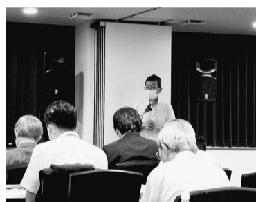
札幌で行われた「支払総額表示」に向けた説明会

2030年までに15万基(うち急速充電器3万基)の整備を目指している。検討会の委員からは「適切な場所に、適切な台数を整備すべき」などの意見が出た。 検討会には、充電器関連事業者、高速道路会社、自動車関連団体をはじめ、商業施設、住宅関連業、観光・宿泊業の業界団体も参加。自治体からは東京都が出席した。 公共用の充電設備は今年3月末で国内に約3万基(うち急速充電器は約9千基)ある。ただ、10年前から設置が始まったため、旧世代の充電器の割合が高く、充電器の更新や利便性、稼働率の問題から設置場所ごとに設置をテコ入れする方策を検討