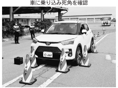
車に乗り込み死角を確認