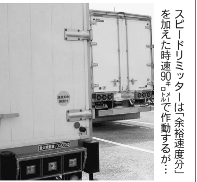
スピードリミッターは「余裕速度分」を加えた時速90キロで作動するが...

警察庁は、大型トラック(車両総重量8ト以上、最大積載量5ト以上)の規制速度を引き上げる検討を始める。有識者検討会を設置し、年内をめどに提言をまとめる。人手不足が深刻なトラックドライバーの労働環境改善などにつなげる狙いだ。重大事故が増えるなどの懸念も根強く、議論は曲折も想定される。 中・大型トラックなどの高速道路における最高速度は、1963年に道路交通法施行令で時速80キロと定められた。その後、国土交通省は道路運送車両法に基づく保安基準を改正し、2003年9月から「速度抑制装置(スピードリミッター)」の装着を義務づけた。 スピードリミッター義務化の背景には、98年当時、高速道路での死亡事故原因の2割強を大型トラックが占めていたことがある。このうち、約半数が追突事故で、85%で法定速度を超過していた。車重の重い大型トラックの衝突は重大事故につながりやすい。このため、国交省は欧州の事例なども参考に検討会で議論を重ね、大型トラックなどにスピードリミッターの装着を義務づけることとした。 スピードリミッターは規制速度に「余裕速度分」を加え、時速90キロを超えると作動するよう、国交省の