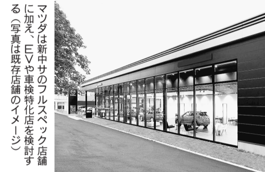
マツダは新中サのフルスペック店舗に加え、EVや車検特化店を検討する(写真は既存店舗のイメージ)

カー専売の「GRガレージ」に次ぐクラウン専門店を出店する方針だ。看板車種を活用し、ブランド力の強化につなげる。