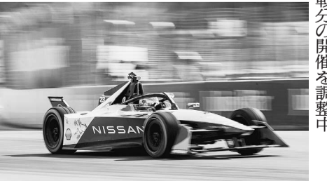
日産のフォーミュラEマシン

月、小池百合子都知事がFIEOと協定を結び、公道レースの開催に向けて関係省庁なども調整を続けていた。開催決定を受け、小池知事は「このレースは持続可能な国際都市を目指す上で、ゼロエミッション車の普及に弾みをつけ、東京の魅力の世界に発信する絶好の機会となる」とコメントした。