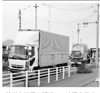
輸送力不足の解消へ、連携を促す

アと比べ輸送効率の改善が特に難しいとされる。都市間距離が長く、各地域の人口密度が低いなど、高効率化の足かせとなる要因が少なくない。フィジカルインターネットを推進して複数荷主の商品を共同配送できる仕組みができれば、輸送力不足が懸念される「2024年問題」などの解決にもつながる。 フィジカルインターネットは、デジタル化を通じて運搬物資や倉庫の空き状況など物流に関するデータを統合し見える化することで、複数事業者が倉庫や輸送車両などをシェアできる体制を整える構想。経産省では2040年までに実現する計画を立てている。