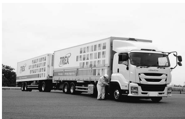
ダブル連結トラック

商品などを長距離で運ぶ輸送と、顧客からの注文を届けるための配送の共同化も広がっている。ヤマト運輸や日本通運など4社は19年から連結トラックで関東―関西間での共同輸送を実施。食品や事務機器など1カーなどでも同業種や異業種間で共に商品を輸送・配送する動きが広がっている。