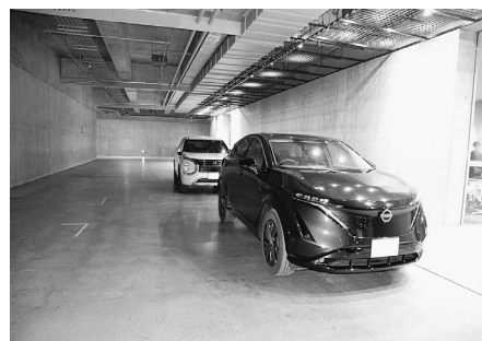
日産自動車と北海道三菱は試乗会で電動車をアピール

トヨタのブースでは水素教室が行われたほか、札幌地区トヨタ会が小型電動キックカー「PIUS」(ピウス)を活用したキッズエンジニアを実施。各社のメカニックがサポート役となり、各チャネルのつながりを着用した子供が楽しそうにピウスを組み立てていた。