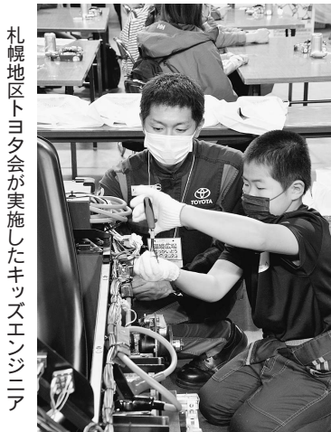
札幌地区トヨタ会が実施したキッズエンジニア

内各地から来場者が集まった。入場してすぐ目の前に現れるのが、トヨタ自動車のFCEVバス「SORA」だ。視察した秋元札幌市長は、FCEVバスの仕組みや全国他都市での導入状況などについて対応した担当者に熱心に聞いていた。