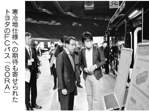
寒冷地仕様への期待も寄せられたトヨタのFCEVバス「SORA」

トヨタが展示した燃料電池(FCEV)バス「SORA」には、札幌市の秋元克広市長らが視察に訪れ、寒冷地に対応した車両の開発などに期待を寄せた。